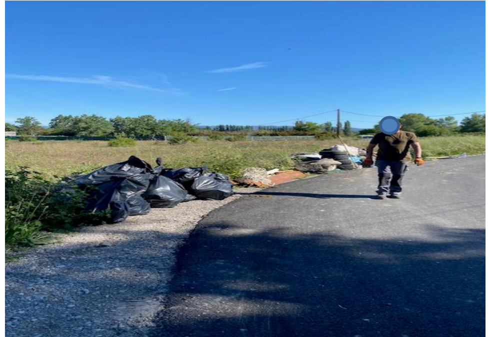
TOUT LE LONG DE CETTE VOIE OMBRAGEE, DE NOMBREUX PNEUS SONT JETES A MEME LE SOL, LE LIEU EST MAGIQUE MAIS SI DEGRADE !