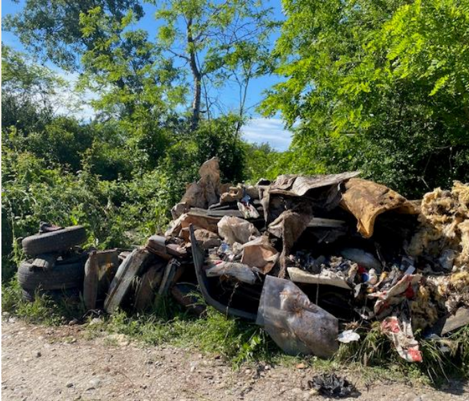
LE 1 er SITE DANS LA ZONE DE ISCLES DU MULET