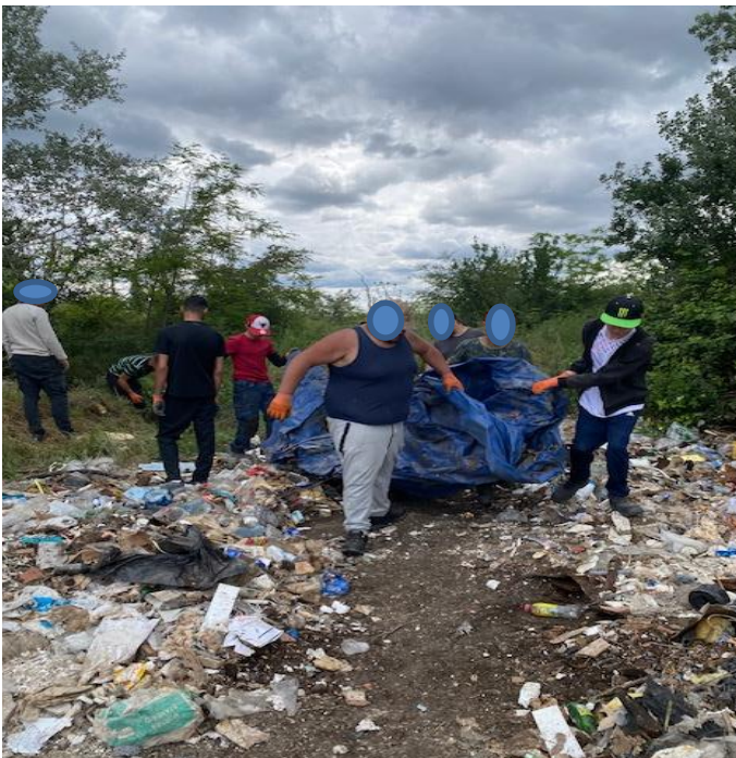
La coopération émerge dès la première journée de travail sur le premier site, on démarre bien.

Douze personnes en contrat à durée déterminée ont été présentes durant toute l'action ainsi qu'une personne en mission de travail d'intérêts généraux. C'est une équipe discrète mais qui travaille consciencieusement et à l'écoute des consignes données. Deux générations se côtoient et l'on peut percevoir dès aujourd'hui un mode de coopération entre eux. Un couple qui fait partie de ce groupe travaille énormément côte à côte et ne ménage pas sa peine. C'est en fin d'après-midi de la première journée que quelques conversations et quelques sourires commencent à s'esquisser sur leurs visages.