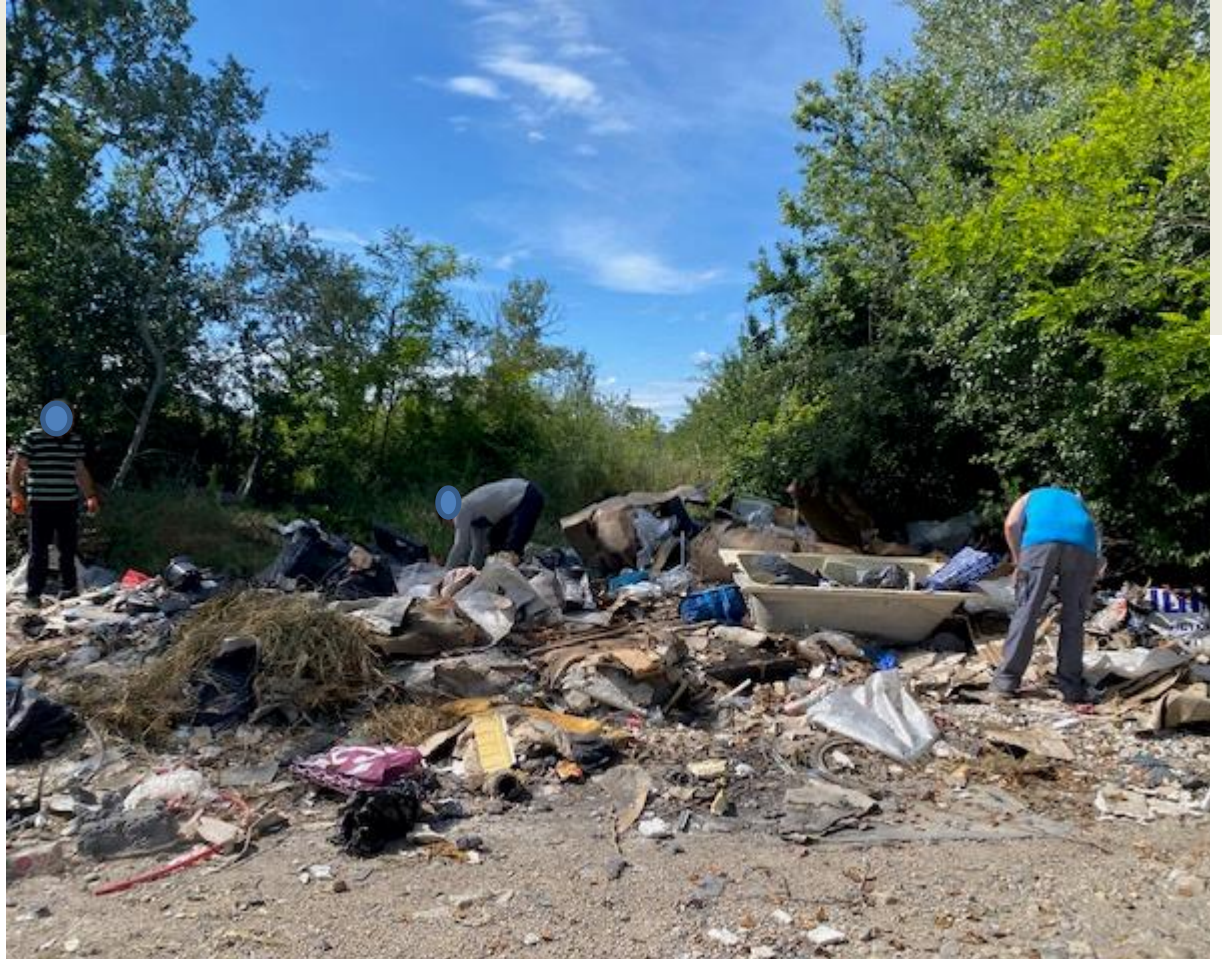
CE SITE FUT LONGTEMPS POLLUE PAR DES TONNES DE DECHETS EN TOUT GENRE EMPECHANT UN ACCES NATUREL AUX BERGES DE LA DURANCE

Par le soutien de la mairie, les 9 sites pollués ont été rendu aux Pertuisiens/Pertuisiennes et la biodiversité reprendra sa place.