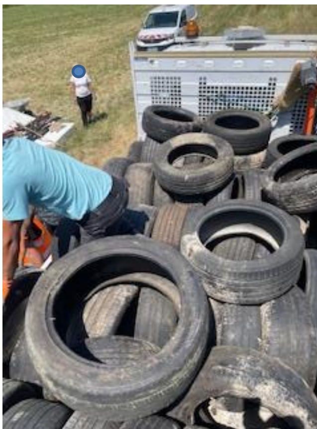
Deux bennes de pneus jetés près d'un champ de blé

L'équipe a le moral, la coopération avec les services techniques de la Mairie n'ont jamais été aussi positif et constructif, le responsable est toujours présent et mène son équipe avec efficacité, sympathie et professionnalisme.