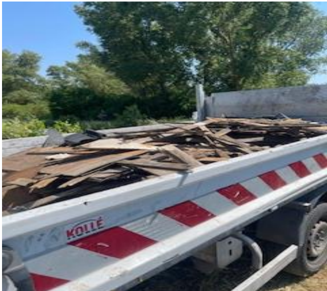
Une benne de plaque de bois industriel