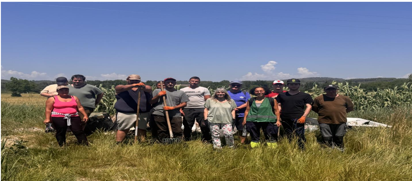
Une équipe enthousiaste, qui a fait équipe, épaulée par une Mairie volontariste