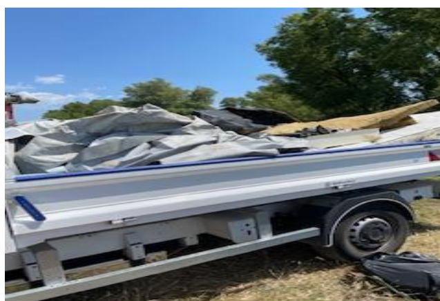
Une benne de déchets plastique : bâche de piscine et autres